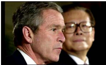
Bush e Jiang Zemin a Crawford

religiosa e del riconoscimento dei diritti dei cittadini di Hong Kong.