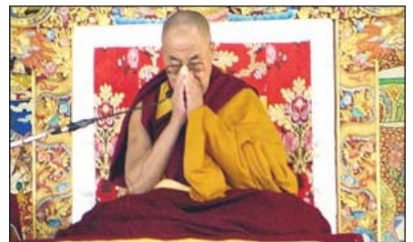
Il Dalai Lama a Bodhgaya

Lo stesso 24 dicembre, mentre per l'attivista cinese si privano le porte del carcere, il segretario del Partito Comunista dello Xinjiang, Wang Lequan, rendeva noto che le forze di sicurezza avrebbero duramente represso, nella regione, le cosiddette "forze del male": il separatismo, il terrorismo e la criminalità.