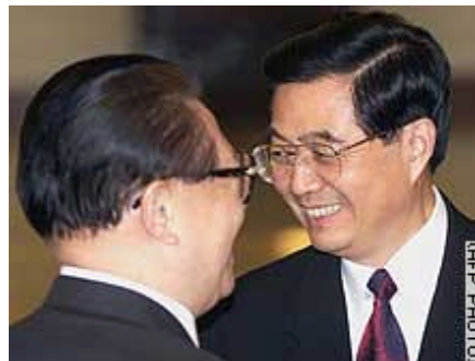
Jiang Zemin e Hu Jintao

Pechino, 8-15 novembre 2002. Alla presenza dei 2114 delegati che affollavano il Grande Palazzo del Popolo, il 16° Congresso del Partito Comunista Cinese ha ufficialmente sancito il passaggio dei poteri da Jiang Zemin a Hu Jintao. Il nuovo leader, che ha immediatamente assunto la carica di Segretario Generale del Partito, diverrà presidente della Repubblica Popolare solo nel marzo 2003, in ottemperanza alla precisa volontà del leader uscente che, per favorire