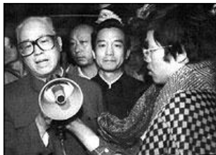
Zhao Ziyang a Piazza Tienanmen

Pechino, 17 gennaio 2005. Si è spento a Pechino, all'età di ottantacinque anni, Zhao Ziyang, ex segretario generale del Partito Comunista Cinese, allontanato dalla sua carica e costretto agli arresti domiciliari dal 1989, quando, all'epoca dei fatti di Tienanmen, raggiunse gli studenti sulla piazza dimostrando loro la propria solidarietà. Temendo l'imminente, sanguinosa repressione, con le lacrime agli occhi, li supplicò di por fine alla loro protesta. Nato nella provincia dello Henan, nella Cina centrale, nel 1919, Zhao fu eletto segretario della provincia del Guandong nel 1960. Caduto in disgrazia durante il periodo della Rivoluzione Culturale per le sue