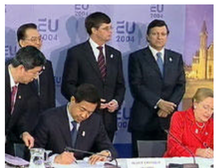
La firma degli accordi