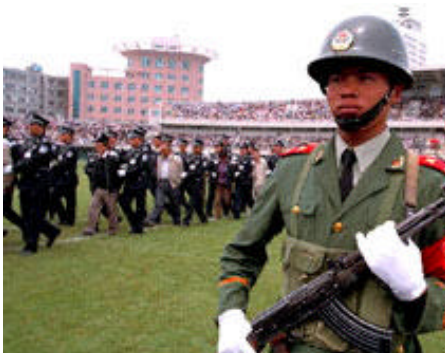
Esecuzioni in Cina

Shanghai, 29 novembre 2004. Secondo quanto riportato da organi di stampa cinesi, Pechino è sul punto di apportare sostanziali modifiche alla legge sulla pena di morte. La nuova legislazione, alla quale sta lavorando la Suprema Corte di Giustizia, riserverebbe esclusivamente a questo stesso organismo il potere di decidere in merito all'applicazione delle sentenze capitali. Secondo il parere di alcuni eminenti esperti di diritto, la nuova normativa ridurrebbe di almeno un terzo il numero delle condanne a morte eseguite ogni anno in Cina che attualmente si ritiene siano circa diecimila.